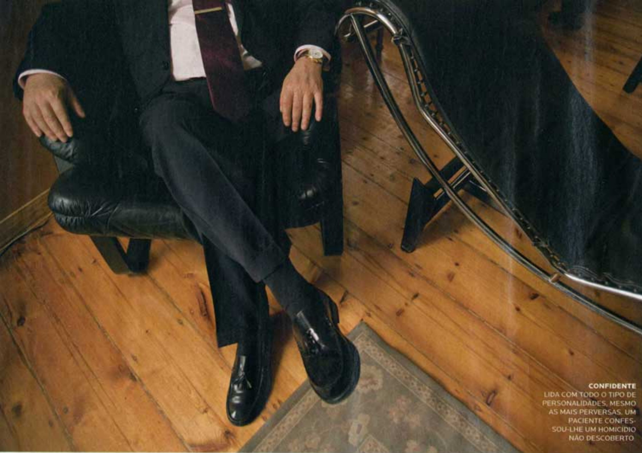
CONFIDENTE LIDA COM TODO O TIPO DE PERSONALIDADES, MESMO AS MAIS PERVERSAS. UM PACIENTE CONFES- SOU-LHE UM HOMICÍDIO NÃO DESCOBERTO