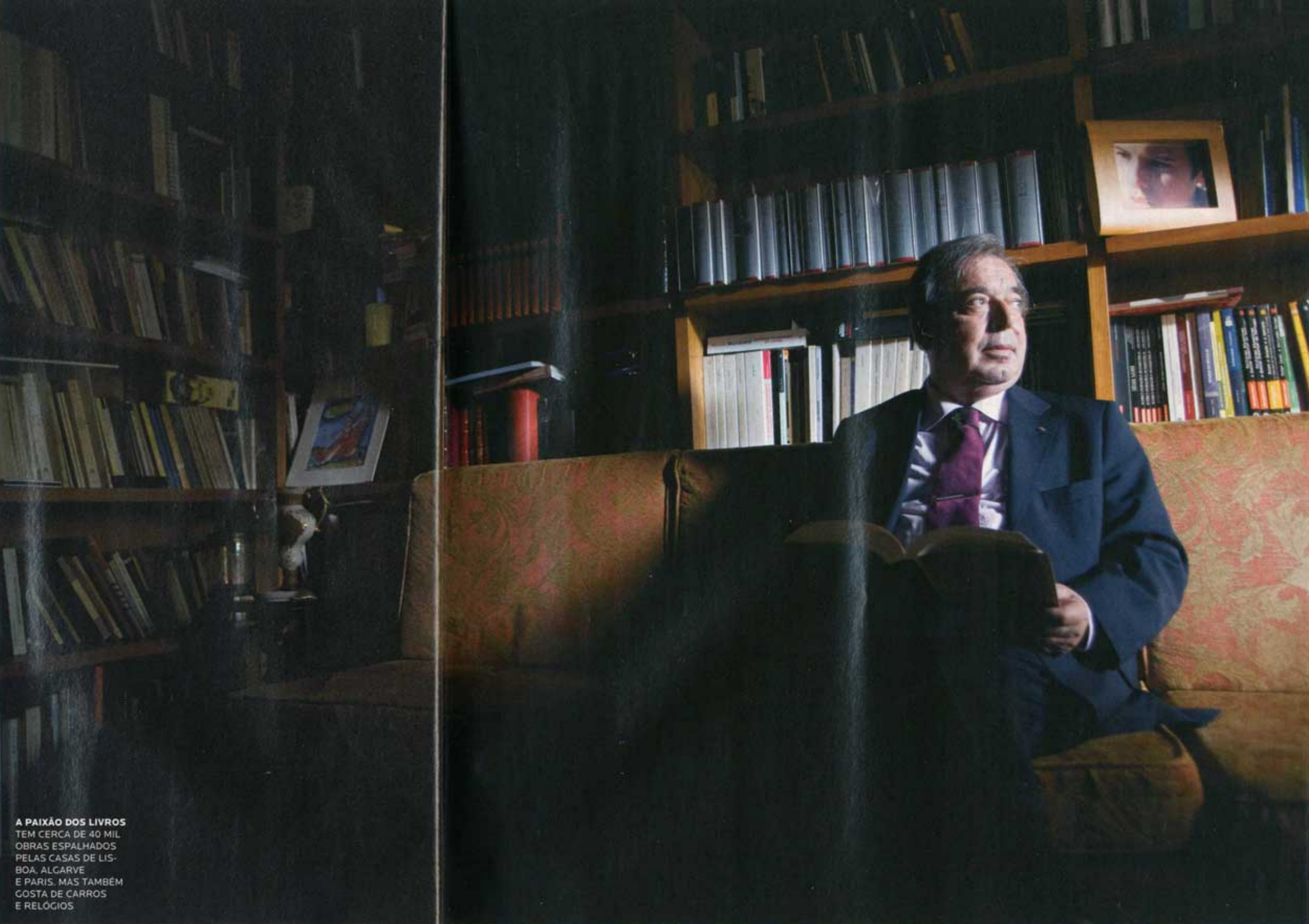
A PAIXÃO DOS LIVROS TEM CERCA DE 40 MIL OBRAS ESPALHADAS PELAS CASAS DE LISBOA, ALGARVE E PARIS, MAS TAMBÉM GOSTA DE CARROS E RELÓGIOS

A psicanálise continua então a ser a melhor — a única — forma de chegar ao inconsciente humano? A psicanálise é, por definição, a ciência do inconsciente, no sentido em que Freud o delimitou. Ou